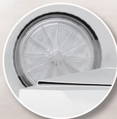
Filtro Batteriologico Alta qualità (2µm)