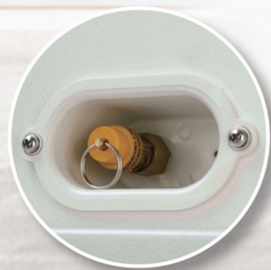
Valvola di sicurezza Protezione contro un possibile aumento di pressione all'interno della camera