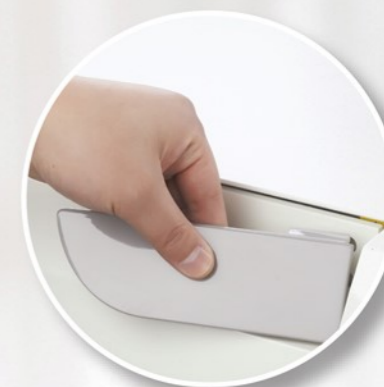
Chiusura porta Elettrica e Meccanica