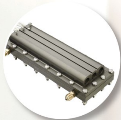
Generatore di vapore Design brevettato ad alta efficienza e affidabilità