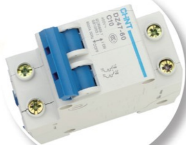
Interruttore Termico Protezione della macchina in caso di dispersione della corrente o corto circuito